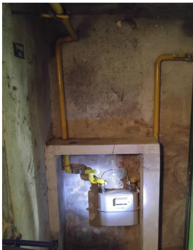
Obrázek 2 Stávající plynoměr G16, umístěný v chodbě, ocel 6/4"