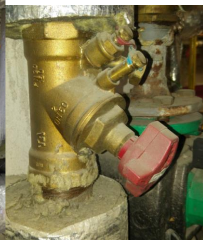
Obrázek 9 V levém obrázku větve pro ÚT, uprostřed a vpravo detail regulační a vyvažovací armatury.