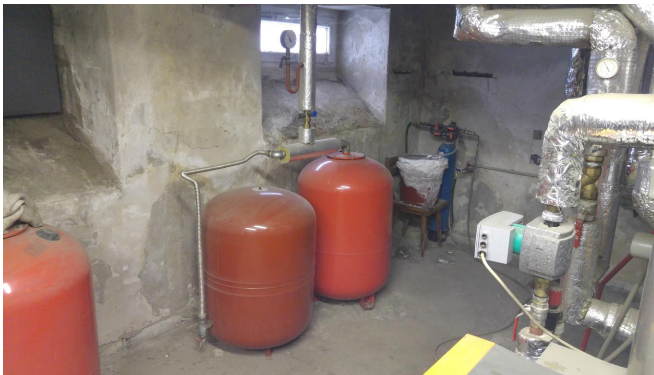
Obrázek 6 2 x expanzní nádoba 250 l / 6bar