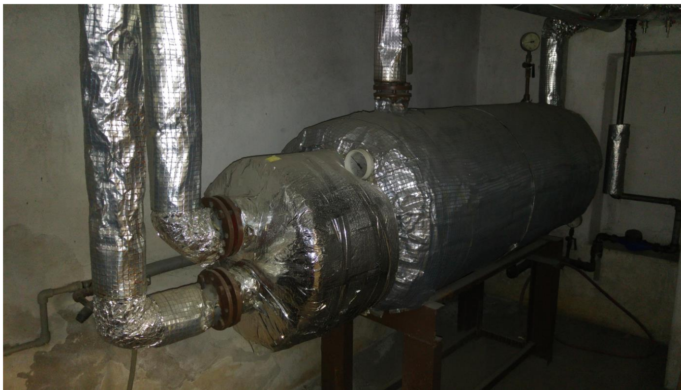
Obrázek 8 Zásobníkový ohřivač TV \varnothing 0,6m, délky cca 2,0m