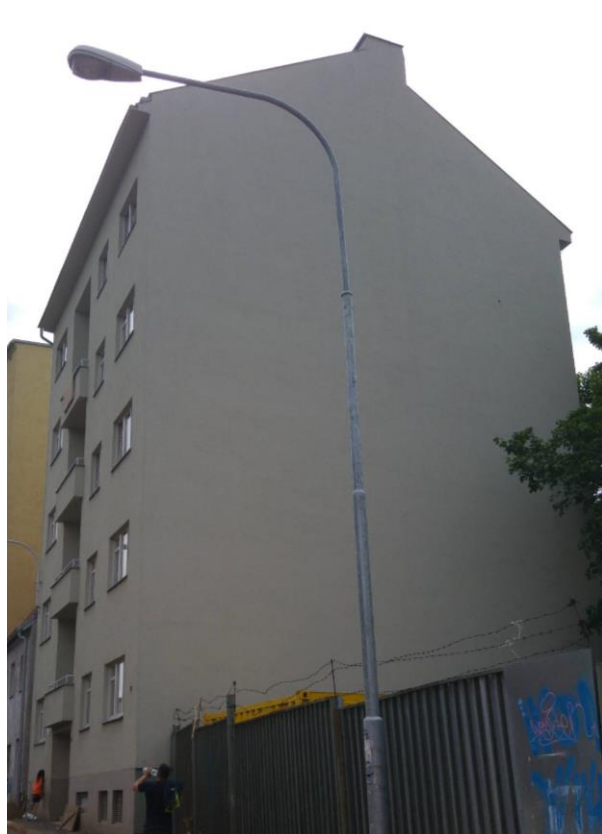
Obrázek 1 Řešený bytový dům, Francouzská 12, Brno