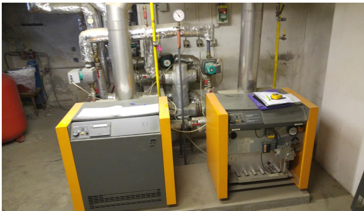
Obrázek 3 Stávající plynové kotle Rapido GA 110/2/41, 45kW